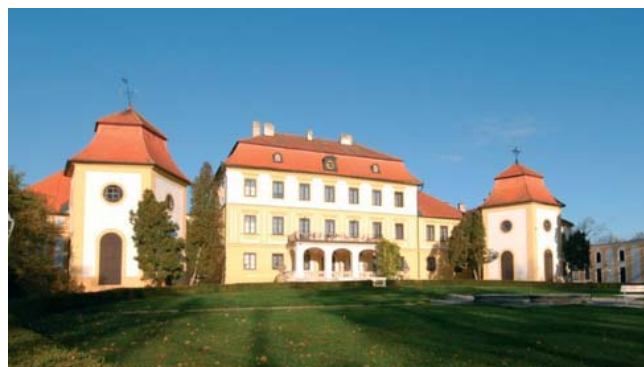
Zámek Kravsko u Znojma

Pokud jsi, milý čtenáři, pilně při tomto neveselém čtení, došel až sem, zasloužíš si ještě jednu perličku, jež může také dokládat páchanou trestnou činnost při tomto privatizačním projektu. Úvěr, který si vzal státní podnik Crystalex na zalátování svých provozních problémů, a který pak byl napasován městu Harrachov, měl od počátku ručení nemovitým majetkem. A to nemovitostmi na jižní Moravě, konkrétně v obci Kravsko, kde se nachází zámek, jenž byl v té době rekreačním zařízením Crystalexu. Takže zatímco samotný úvěr přejímá město Harrachov, jím zastavené nemovitosti i po privatizaci zůstávají v majetku Crystalexu, aby pak za několik let později mohly být (existuje dokument, na základě něhož se J. F. World Brokers vzdává zástavního práva ve prospěch Crystalexu a.s.) prodány soukromé společnosti, jež ze zámku Kravsko udělala luxusní hotel. Dnes, mimochodem, zavřený. Aktem výmazu zástavního práva byl z největší pravděpodobností dovršen proces vyvedení privatizovaného majetku odděleného od souvisejícího úvěrového příslušenství v rámci