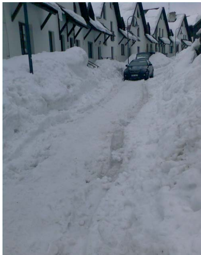
Stav komunikace v centru po několikadenní (ne)údržbě.

Současné vedení města, opírající se o výsledky provedené občanské ankety, není zastáncem přílišného chemického ošetřování komunikací. Jednak razí utopistickou vizi „bílého Harrachova“ a také je přesvědčeno, že může tímto způsobem na zimní údržbě ušetřit. Trochu však pozapomnělo, že sníh z komunikací se musí stejně odstranit takřka nejlepším způsobem jak tak učinit, je naházet ho frézou občanům do zahrad apod. Došlo samozřejmě i na vyvážení, hlavně v centru, což je však varianta stojící zvýšené peníze. Jen v žádném případě nesolit silnice, jde nám přeci o „bílý Harrachov“, byť při této variantě znatelné množství sněhu odteče pryč a zůstane ho pak výrazně méně. V neposlední řadě je však třeba vzpomenout na „bílý Harrachov“ v okamžiku jakékoliv menší oblevy a následného odtávání sněhu. Romantika mizí s každým menším oteplením kdy špinavý sníh plný kamínků a ostatního nepořádku všudypřítomně lemuje okraje silnic, zahrad apod. Nesmí se však ani zapomenout na zvýšené náklady související s odklizením všudypřítomných kamínků.