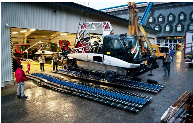
Vítej v Harrachově, druhý Leitwolfe!