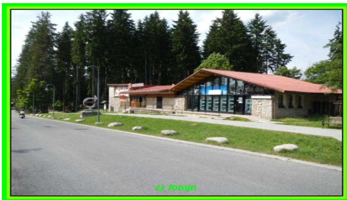
Záběr na poutač (mezi lampami) před zbouráním a níže po něm...